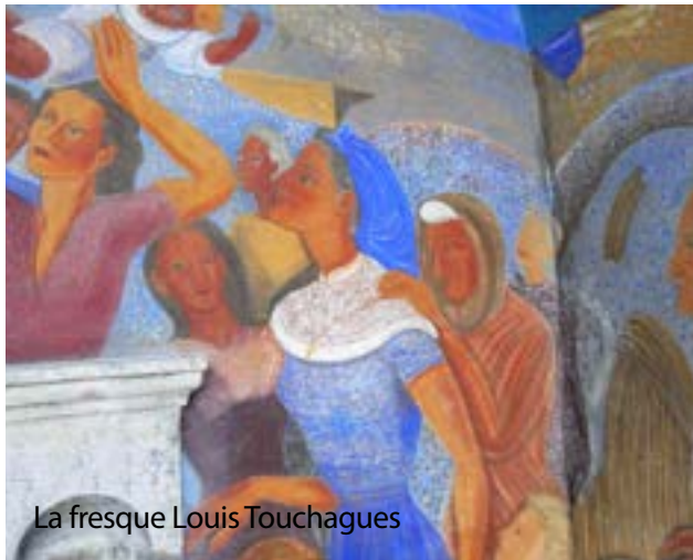
La fresque Louis Touchagues

Le jardin potager se déploie au sud. Il permettait aux ermites de vivre en parfaite autonomie. C'est aujourd'hui une terrasse de verdure qui surplombe la métropole lyonnaise et ses collines de Fourvière et de la Croix-Rousse.