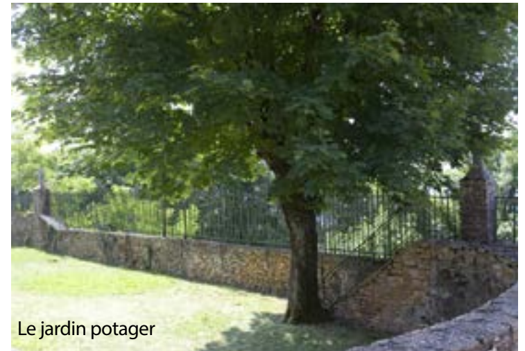
Le jardin potager