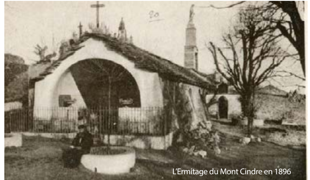
L'Ermitage du Mont Cindre en 1896